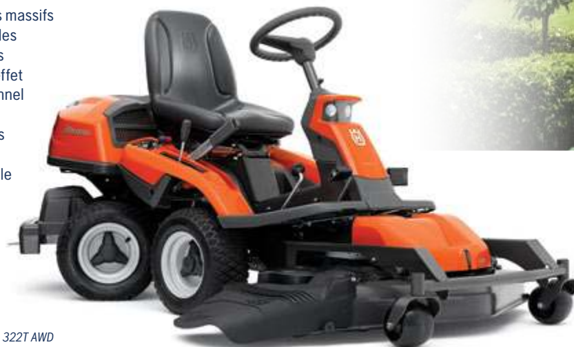
Husqvarna R 322T AWD

Les arbres, les buissons et les massifs de fleurs ne constituent pas des obstacles pour nos tondeuses articulées. Celles-ci sont en effet dotées d'un système directionnel qui permet au conducteur de braquer les roues arrière sous la machine. Il en résulte une manœuvrabilité exceptionnelle et une adhérence accrue.