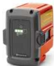
Batterie Husqvarna BLi20