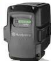
Batterie Husqvarna BLi150