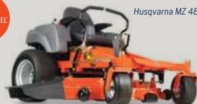
Husqvarna MZ 48

*Tarifs promotionnels valables du 1er mars au 15 juin 2017.