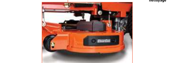
Plateau Clear Cut™ (42 po)